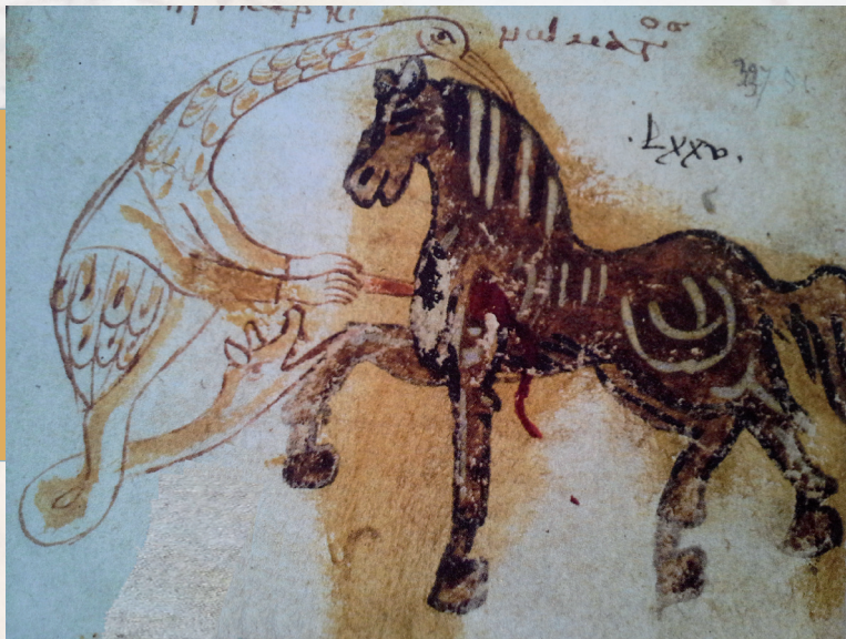
Image : © Stavros LAZARIS Art et science vétérinaire à Byzance, Turnhout 2010